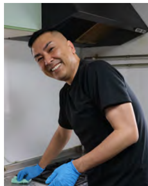
地域活性化起業人

私は上川町で生まれ育ち、中学卒業後に町を離れ、現在は千葉県在住で新潟県の食品メーカーに営業や商品開発に携わっています。仕事を通じて各地を訪れる中で、年齢を重ねるほどに上川町の魅力を実感するようになりました。大雪山をはじめとする豊かな自然や食文化も魅力ですが、私が最も誇りに思うのは「人」です。地域のつながりや温かさは、今では貴重な財産だと感じています。現在は地域活性化起業人として町に関わり、地域を元気にする第一歩は「人が集まること」だと考え、旧長栄堂を活用した交流の場づくりに取り組んでいます。