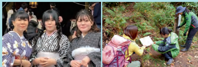
(右) 愛山溪松仙園の登山道の脇道に、ロープを貼っている様子。大雪山の素晴らしい植生を維持するために、人々が踏み入ってしまうないようにロープを張ります。

かったこともありましたが、子どもたちにも家事の面でサポートしてもらいながら働くことができました。やりたいことに挑戦できているので、とてもやりがいを持って仕事できています。