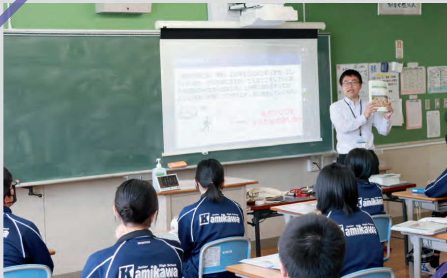
上川中学校で「第10次上川町総合計画について」の説明している様子