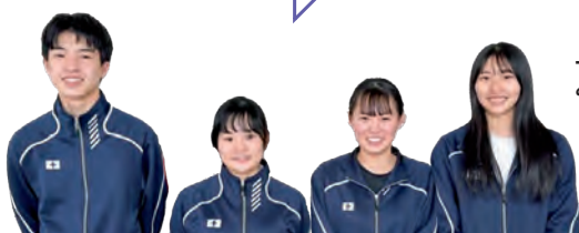
上中生の みなさん