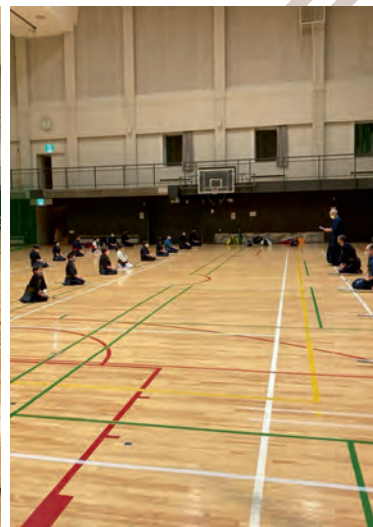
(写真) 普段の上川町剣道連盟の活動の様子

「広報かみかわ」で紹介してほしい！というコミュニティを募集中です！ 詳細は地域魅力創造課（☎2-4063）へお問い合わせください。