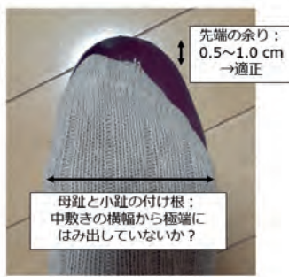
図. 靴のサイズ合わせ

わる転倒リスクが増す可能性があります。母趾や爪の変形など）にもつながります。靴下をはいた状態で中敷きに乗り、先端の余りが0.5〜1.0cmなら適正な長さです。横幅は母趾と小趾の付け根が、中敷きの横幅から極端にはみ出していないかを確認します。（左図）