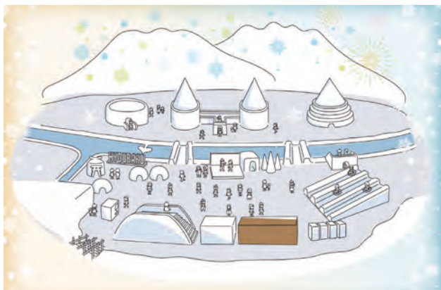
今年の会場完成予想図