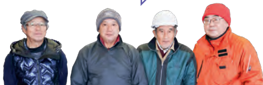
高齢者 事業団の みなさん