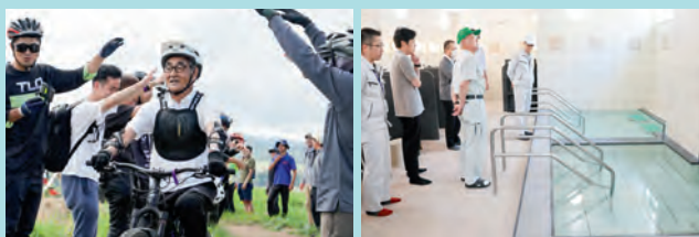
(左) 連携企業「YAMANASHI MTB 山守人」との調印式でマウンテンバイクを試運転する様子 (右) 町内の各施設の設備確認を行い、たいせつの絆の浴室を視察している様子

ン」をコンセプトにまちづくりを推進していますが、単に、外資系のホテルを呼んで、観光客をどんどん呼びこもうとか、そんなリゾート地を思い描いているわけではなくです。上川町は「観光のまち」でもあるけれども、まずは何より