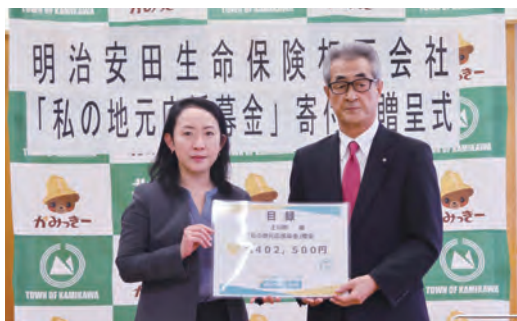
明治安田生命保険相互会社 様

健康増進などに役立ててほしいと402,500円のご寄附をいただきました。寄附金は健康健診事業に活用させていただきます。上川町とは令和4年に包括連携協定を締結しています。