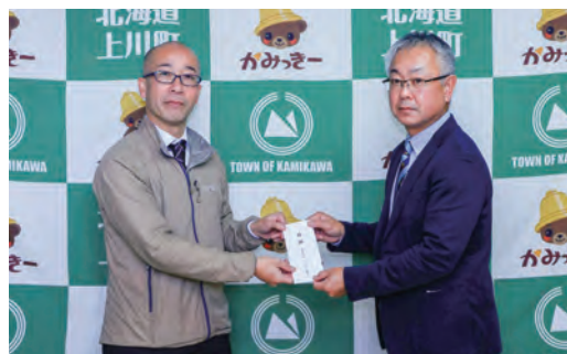
（株）りんゆう観光 様

健康増進などに役立ててほしいと402,500円のご寄附をいただきました。寄附金は健康健診事業に活用させていただきます。上川町とは令和4年に包括連携協定を締結しています。