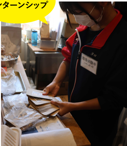
上川高校 インターンシップ