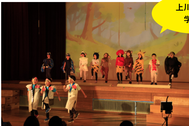
上川小学校 学芸会

9月18～19日に上川高校のインターンシップが行われました。生徒たちは実習先にて実際に仕事を体験し、働くことの大変さや社会人としての心構えを学びました。