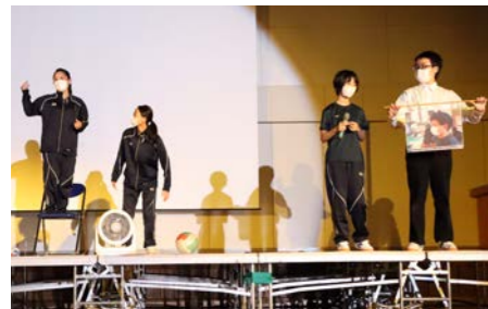
上中の先生 モノマネ大全