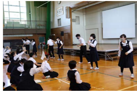
生徒会企画ジェスチャーゲーム