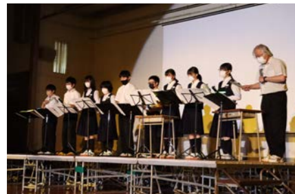
トーンチャイムで演奏