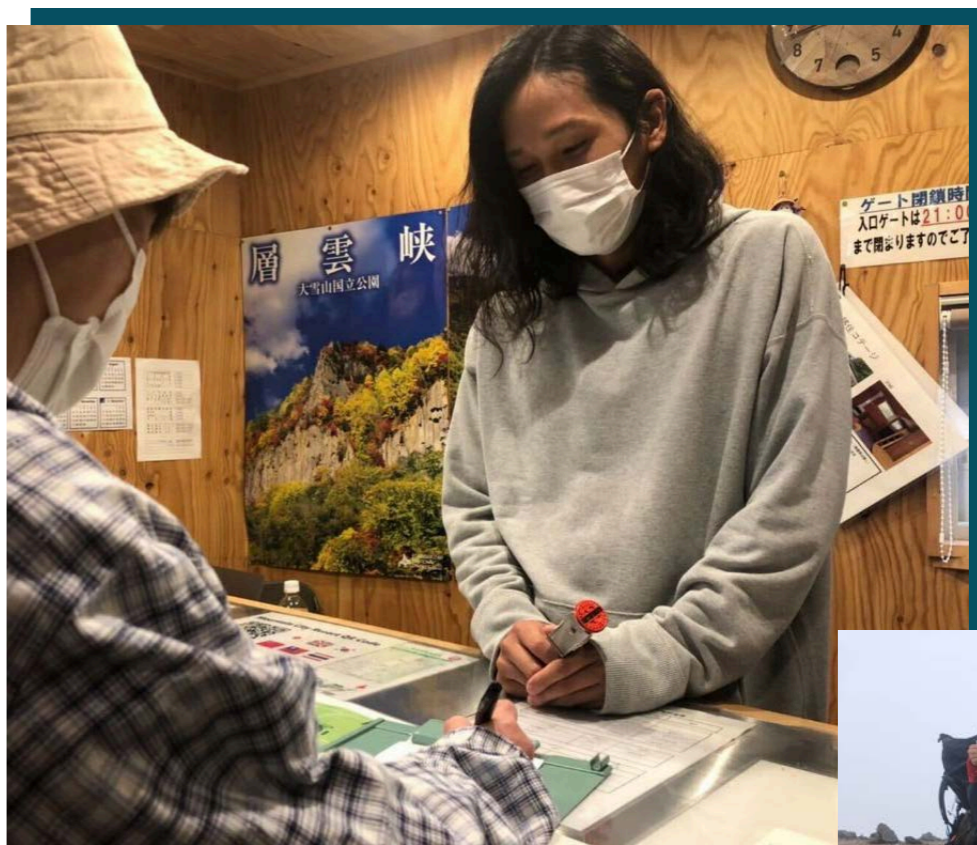
→層雲峡オートキャンプ場での勤務中の様子