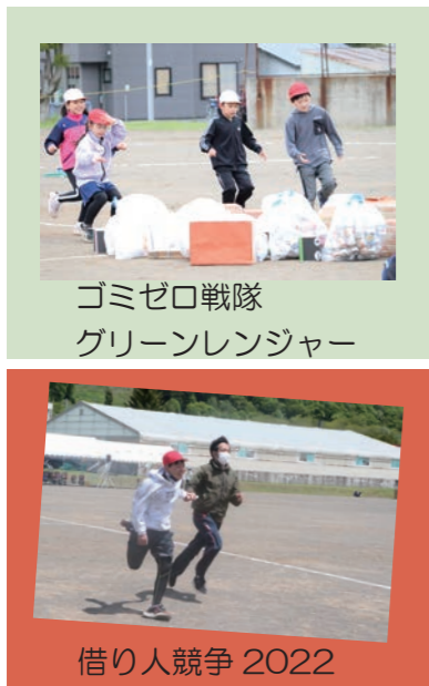
ゴミゼロ戦隊 グリーンレンジャー