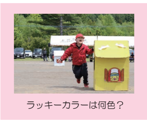
ラッキーカラーは何色?