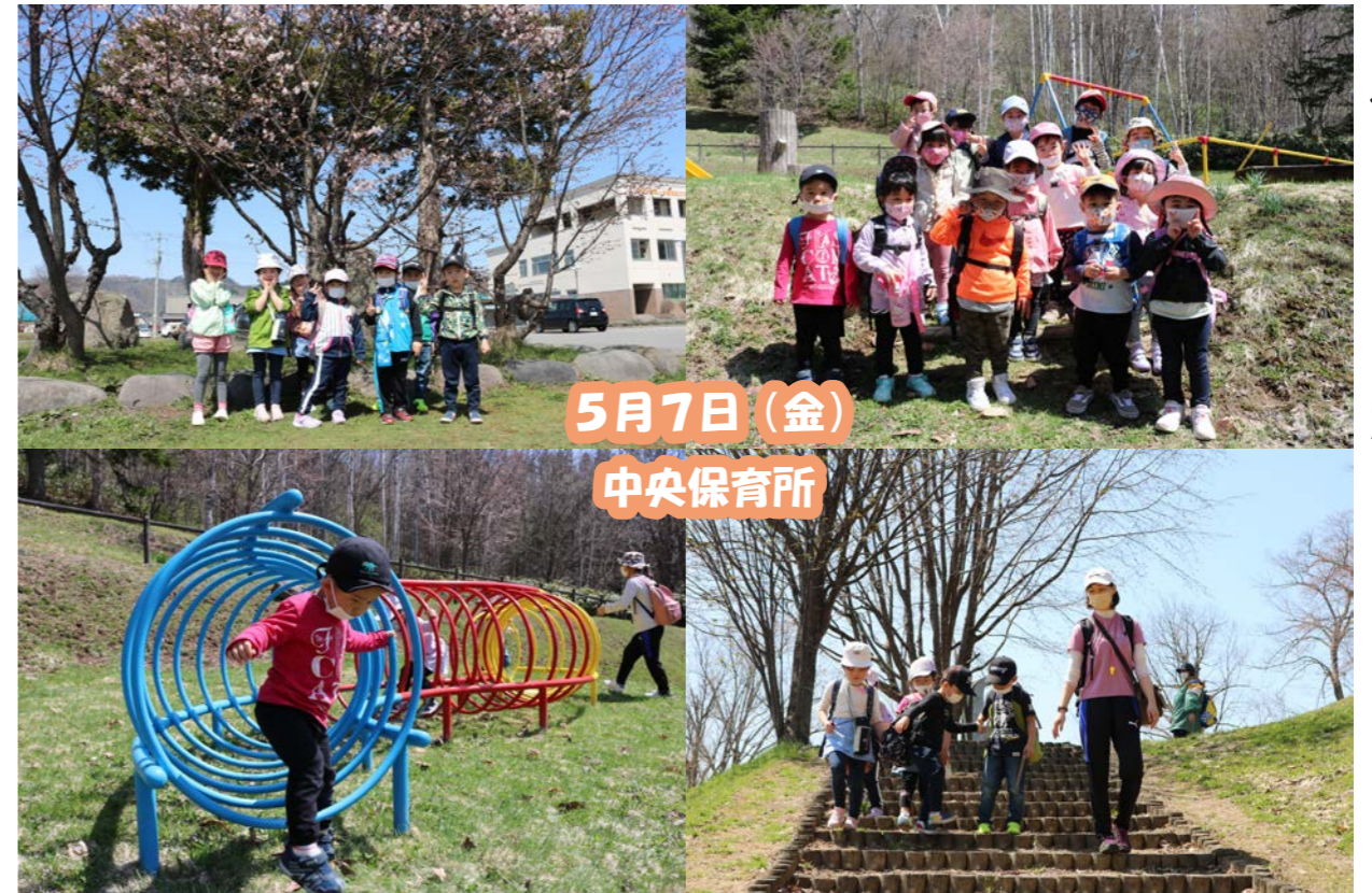
5月7日(金) 中央保育所