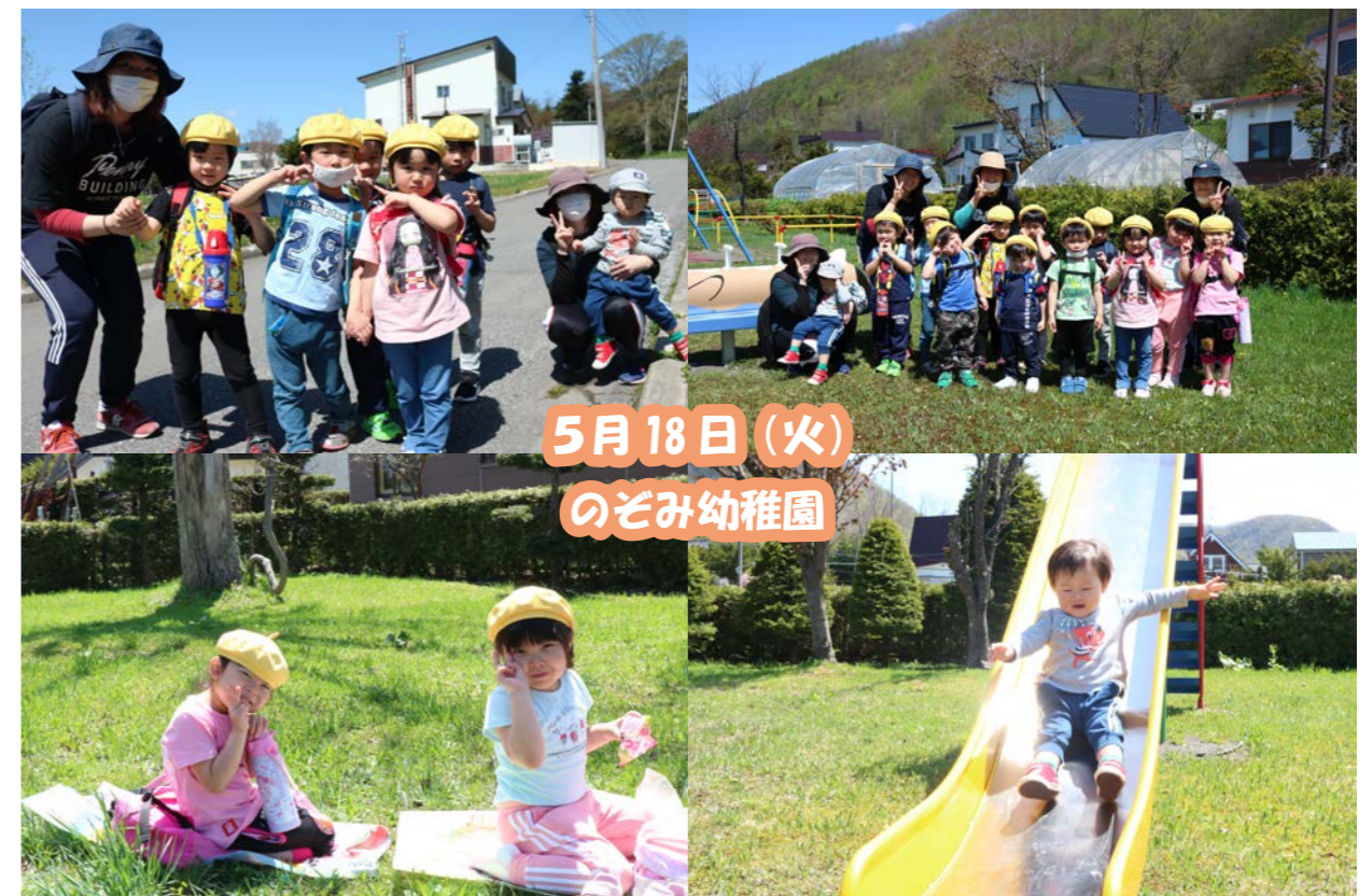
5月18日(火) のぞみ幼稚園