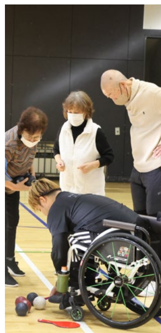
真剣な眼差しで得点確認

「広報かみかわ」で紹介してほしい!というコミュニティを募集中です! 詳細は地域魅力創造課 (☎2-4063) へお問い合わせください。