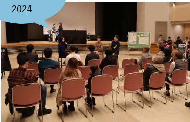
12月7日 KAMIKAWA MIRAI FES が実施されました。トークセッションやTSIフリーマーケット、体験ブースやカフェバーに、300人以上の方が来場し、上川町の持続可能な未来について考える機会となりました。