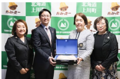
国際ソロプチミスト様

432,400円の寄付金と電話音声明瞭器サウンドアークを寄付・寄贈していただきました。寄付金は健康健診事業に活用します。