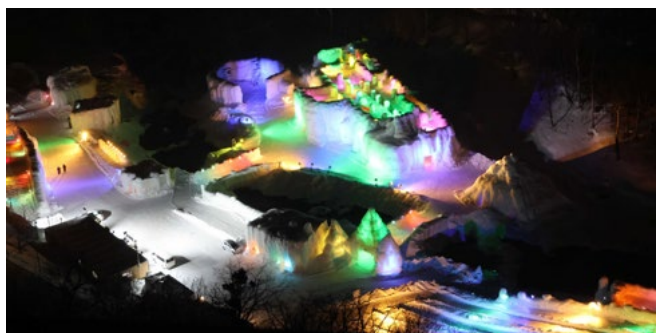
昨年の会場の様子

北海道の冬を代表するイベントのひとつである層雲峡氷瀑まつり、は今年で50周年を迎えます。氷の彫刻のライトアップによる幻想的な光景は、多くの町民や観光客に感動を伝えてきました。今年は50周年を記念して毎日花火の打ち上げやイベントが開催されます。節目の年を盛大にお祝いしましょう。