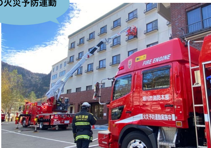
10月15日秋の火災予防運動の一環として上川消防署と町消防団は火災防ぎょ訓練をホテル大雪で行いました。