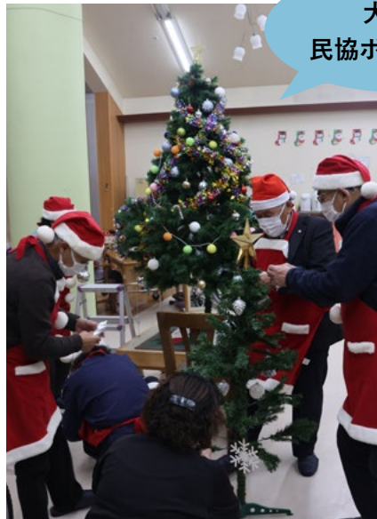
12月5日大雪荘で民生委員児童委員協議会によるクリスマスツリー装飾のボランティアが実施されました。