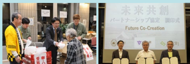
(左) 百三十周年事業の参加者景品を配布している様子 (右) 宮崎県すさみ町、和歌山新富町との未来共創パートナーシップ協定調印式の様子

「みんなが輝くまち かみかわ」をスローガンとして取り組みを行ってまいります。これは町民の皆様が充実した生活を送ることで、いきいきと元気に過ごせる地域になることを目標としています。