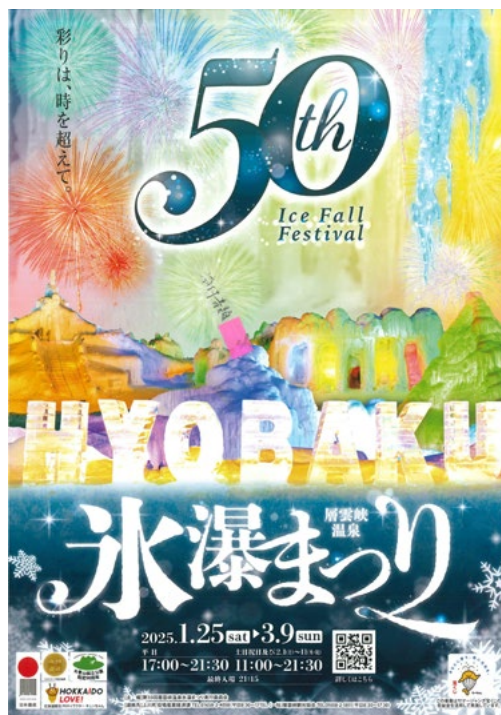
今年の掲載ポスター