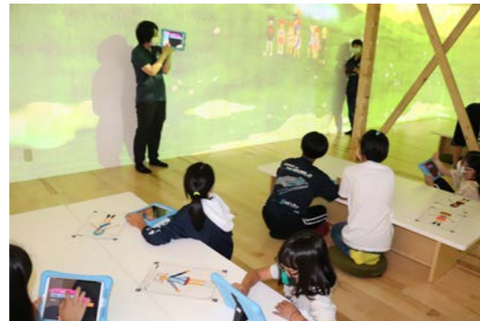
ヌクモでプログラミング学習

参加した児童たちは、普段の生活では味わうことのできない体験を通して成長することができました。