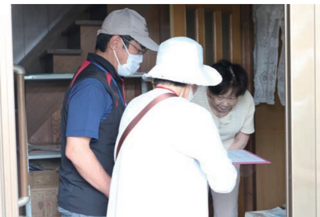
訪問・聞き取りの様子