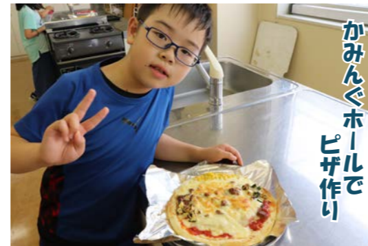
かみんぐホールでピザ作り