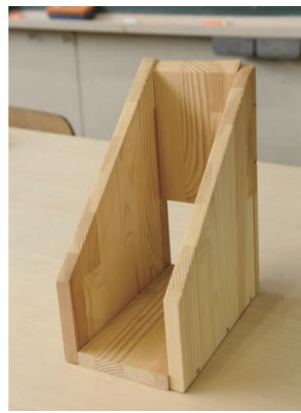
技術の授業でブックスタンドを作りました。バランス良く角の部分紙ヤスリで削る作業が大変でしたが、とてもやり甲斐がありました。