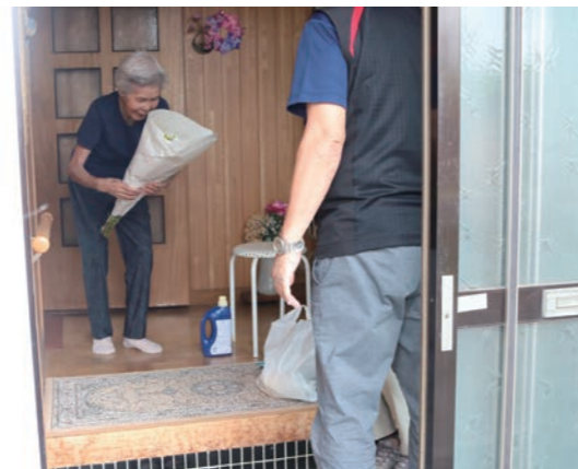
仏花のお取り寄せ（期間限定）