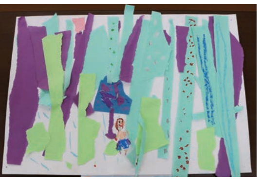
雨がたくさん降っているところを、細くさいた紙で表しました。絵の中には、お気に入りの傘をさして散歩している自分があります。 高橋 香奈子先生