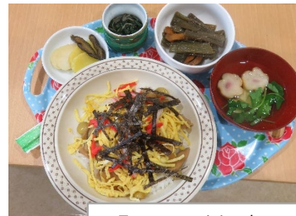
3月のランチ ちらし寿司