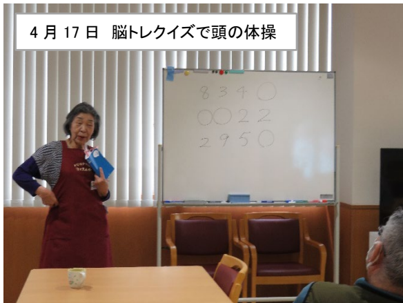
4月17日 脳トレクイズで頭の体操

まちなかには雪の姿もなくなり、桜の花が咲くのが楽しみな季節になりました。連休は出かけたり、来客があったりで忙しいでしょうが、疲れをいやすためにもぜひサロンでゆっくりと楽しんでください。お待ちしております。