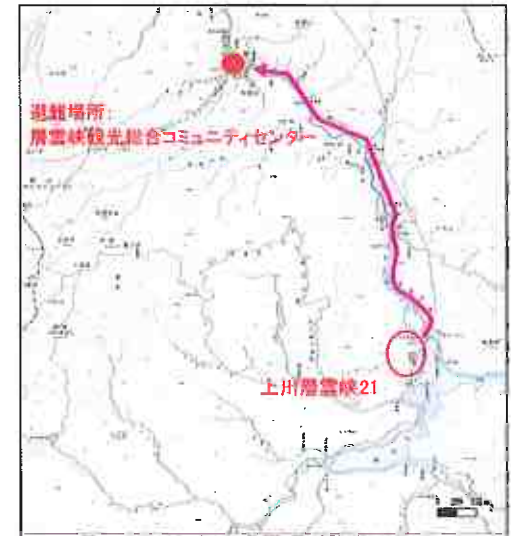
位置図 (図の上位が北を示す)