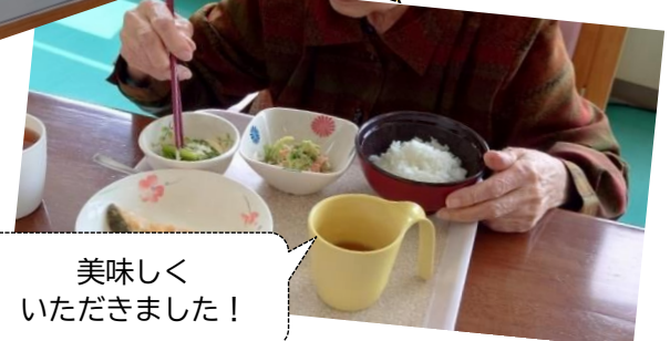
美味しくいただきました！