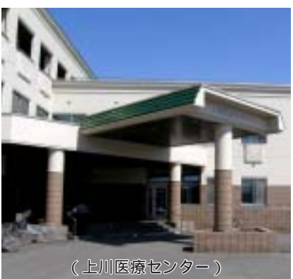
(上川医療センター)