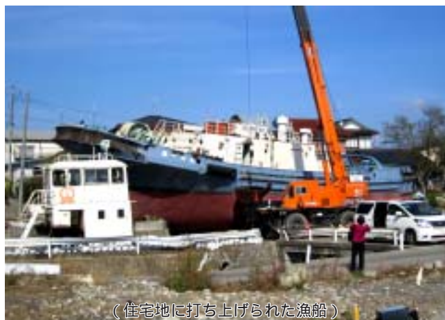
(住宅地に打ち上げられた漁船)

遠野市全体で取り組んでいるのだから、客に対するもてなしの心を強く感じた。ホテルでの夕食前に宿泊客に囲炉裏を囲んで「語り部」が昔々の民話「座敷わらし」や「オシラサマ」を東北弁で静かに語りかけるように話をされ、人々に癒しを与えている姿は観光地を抱える上川町でも学ば