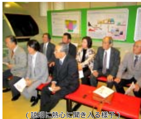
(説明に熱心に聞き入る様子)

には適している。 (イ) 松川発電所は40数年経過しているが現在も安定して発電が行われているが、白水沢の地熱状況も道立地下資源調査所が地質、地化学、物理探査、調査井の掘削の結果、噴出蒸気の状態と比較しても発電には適している。