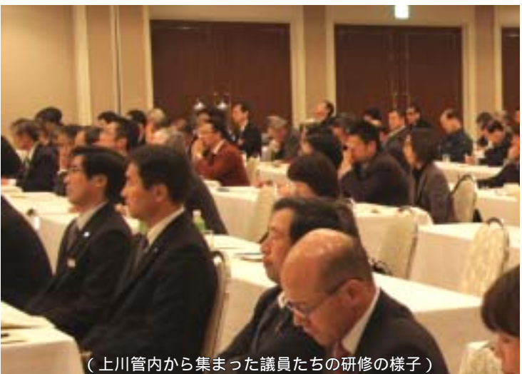
(上川管内から集まった議員たちの研修の様子)

のであることは変えようがない事実であります。新に「テロ」との闘いとしてありますが、4つの戦争形態からはみ出るものでなく、支配するものと支配されるものとの対立の延長であるといえます。