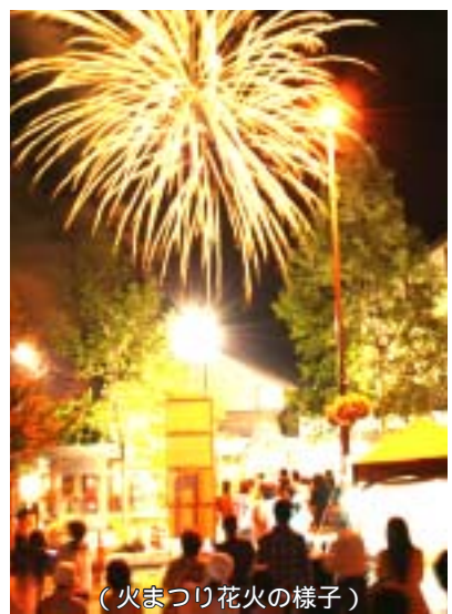
(火まつり花火の様子)

国別内訳としましては、外国人宿泊者の6割以上を占めている台湾は対前年比60.9%、シンガポール57.1%、中国27.7%、香港