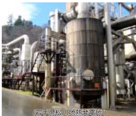
(岩手県松川地熱発電所)

に賦存していると推定され、世界第3位の地熱資源を有していると言われておりますが、この資源量の8割が自然公園内に賦存していると推定され、法規制によりこれらは調査も実施することが出来ない現状にあります。