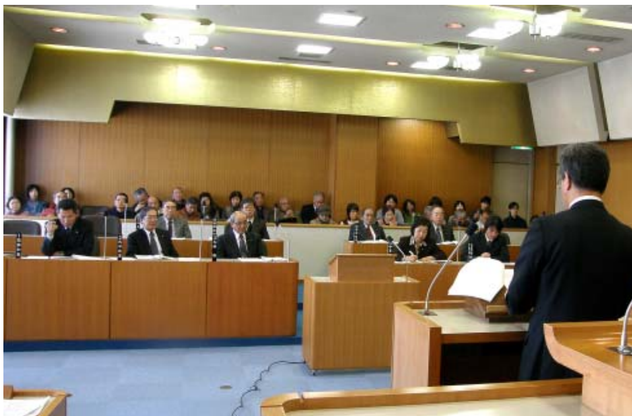
「大勢の傍聴者が詰めかけた12月定例会」 (12月15日、議場)