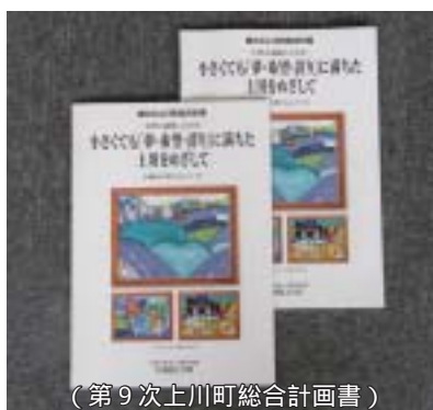
(第9次上川町総合計画書)

政権の担い手が移った日本では政治の低迷が続き未来像を示す事ができないままである。そんな中、地方の行政も安定感のない情勢の中で振り回されている。町長としても町民福祉の向上の為の舵取りが一層むずかしくなっているものと思われる。