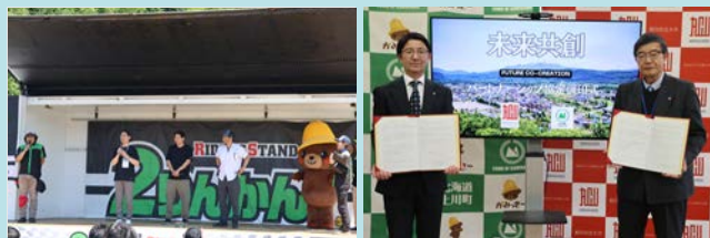
(左) 2りんかん祭りのトークショーの様子。