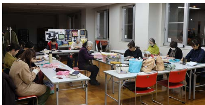
(上) アイヌ刺繍で作り上げた作品。