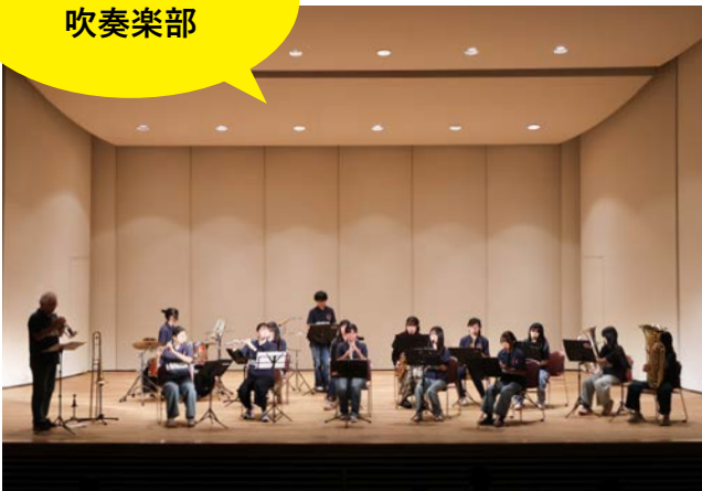
上川中学校 吹奏楽部