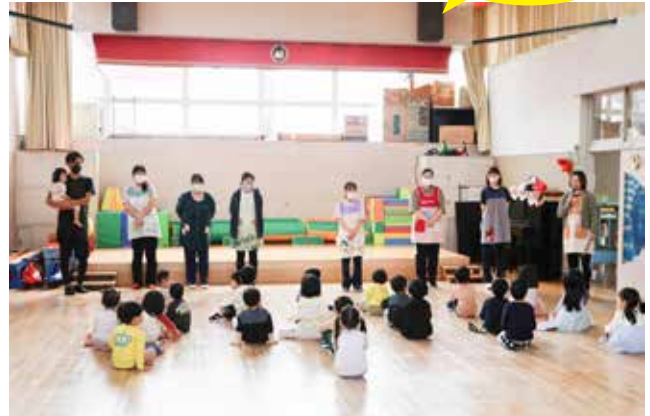
中央保育所 入所式