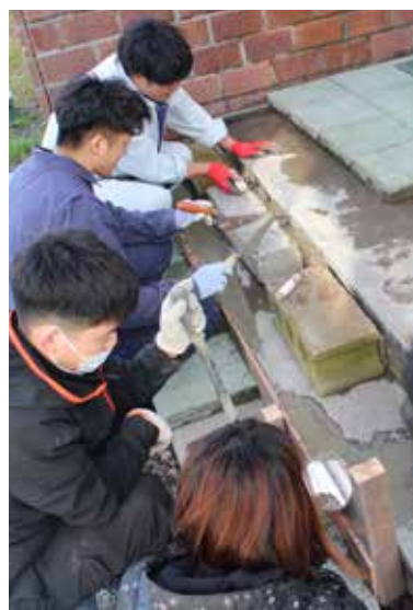
（写真左）指導を受けながら、玄関先を修繕

「広報かみかわ」で紹介してほしい！というコミュニティを募集中です！ 詳細は地域魅力創造課（☎2 - 4063）へお問い合わせください。