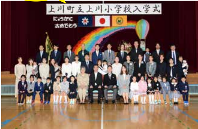
上川小学校 入学式