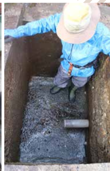
（写真右）菊水での水源地の清掃作業をお手伝い