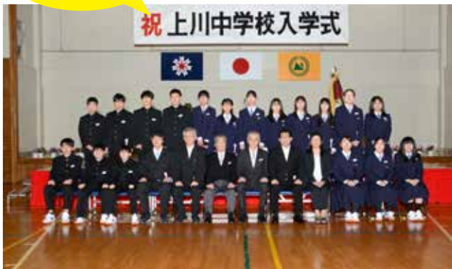
上川中学校 入学式