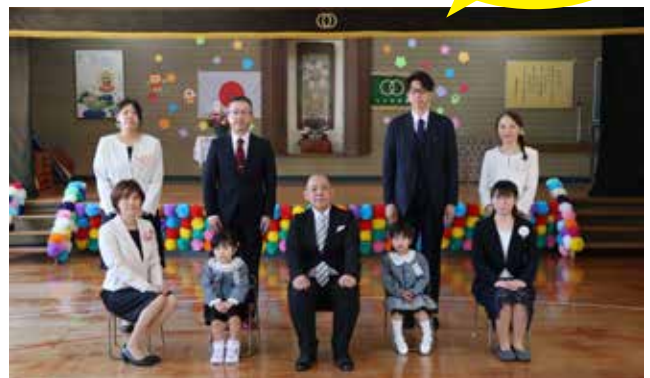
上川幼稚園 入園式