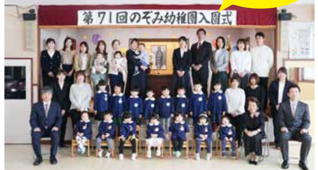
のぞみ幼稚園 入園式