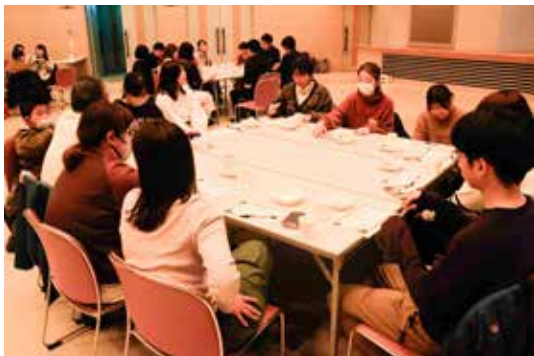
各グループに分かれて、上川の未来で実現したいことをモウソウしました。

3月15日（金）にまちの未来について語り合う「上川超会議」を、133名の参加者と充実したプログラムで開催しました。前半は、林業関係者、PORTOスタッフ、地域おこし協力隊（KAMIKAWORK プロデューサー）など上川町に関わりがある方々が、上川町の未来について熱心に発表をしました。後半は、「上川町で実現したいこと」について各グループごとに話し合いました。上川超会議を通して、上川町の未来に向けたアイディアが生まれ、参加者の多くが交流の場として充実な時間を過ごしていました。