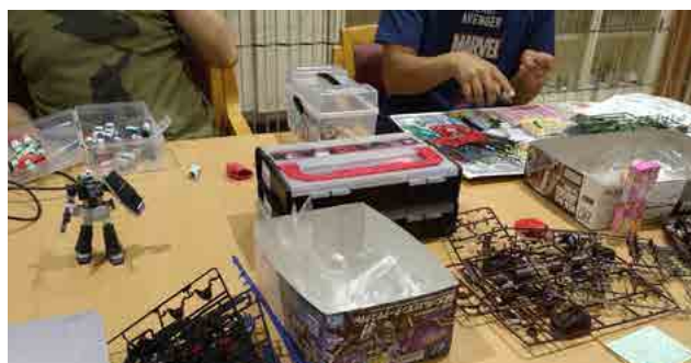
プラモデル制作会の様子

「広報かみかわ」で紹介してほしい!というコミュニティを募集中です! 詳細は地域魅力創造課 (☎2-4063) へお問い合わせください。