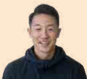
記事を書いたのは… カミカワトレーニングアドバイザー 塚田 コーイチ (健康運動指導士)

もし質問やご不明点などがあれば、いつでもお気軽に健康や生活のこと、また、今回お話しをしたワクチンのことについてご相談いただけます。