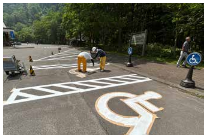
荒井建設株式会社