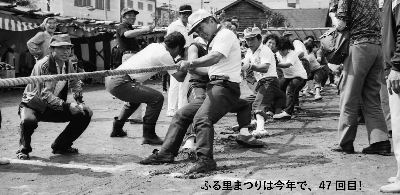
ふる里まつりは今年で、47回目!