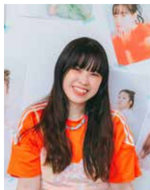
地域おこし協力隊 クリエイティブプロデューサー

女性をメインに撮影し始めて約1年半が経ちました。気付いたことは「自分の容姿に自信のある女性がどこにもいない」ということ。日本は芸能人が「美しい・可愛い」の基準になっていて、外見に厳しい傾向にあります。くしゃくしゃな笑顔だって人の心を掴むように、「可愛い」ってもっとたくさんあると思うんです。私は写真を通して、自身の魅力に気づき、自分に優しく生きる女性を増やしたいと考えています。