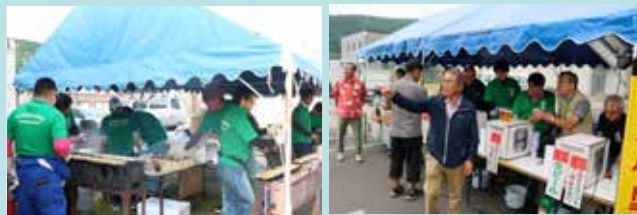
(写真)「青年部ビールパーティ」の様子(撮影:令和2年)。当日は屋台の出店や豪華景品が当たる抽選会などがあり、今年も大盛況でした。

美化や層雲峡の掃除などボランティア活動をしています。また、氷瀑まつりの協力・参加をして主催以外でも町内のイベントを盛り上げています。