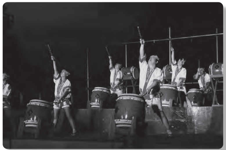
7月29日「層雲峡温泉峡谷火まつり」