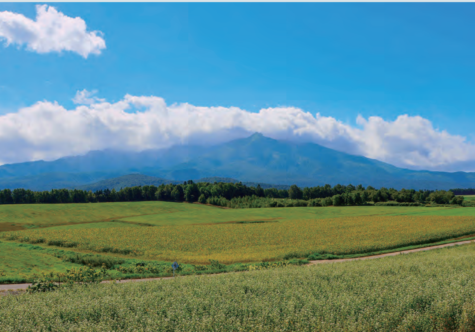
旭ヶ丘から望む大雪山連峰