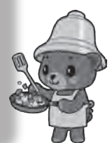
8月5日「セタ交流(どんぐりっこ)」