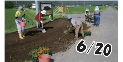
【東雲地域資源保全の会】