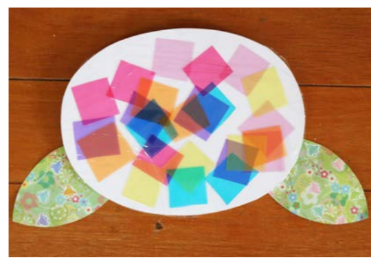
透明折り紙をハサミで切ってアジサイを作りました。たくさんの色の重なりがとてもきれいな作品になりましたね。