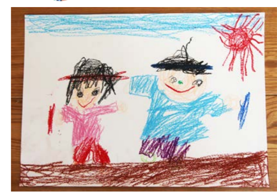
先日行われた運動会の様子を描きました。二色リレーでバトンを持って、のびのびと走っている様子が伝わってきますね。