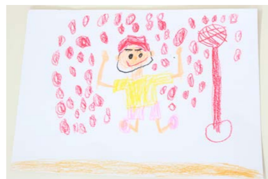
運動会で玉入れをした時の絵を描きました。難しい動きのある絵でしたが、脚の描き方を工夫して仕上げることができました。

LINE公式アカウント 町からのお知らせや、防災情報をお届け。 Facebook 町内の話題や行事、防災情報をお知らせ。