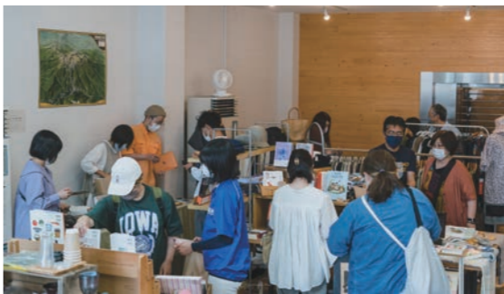
↑ 5月に開催した「本と珈琲と服」