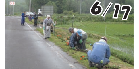
【菊水地域資源保全の会】

資源保全の会による事業は、農村の環境保全を目的に、地域ぐるみで農道の草刈りや農村景観維持活動を実施しています。