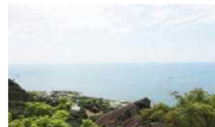
展望台からの眺め